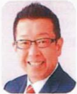
ふじみ野市長 挨拶