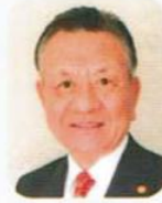
自治組織連合会長 挨拶